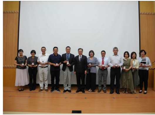
校長與 108 年度資深人員合影