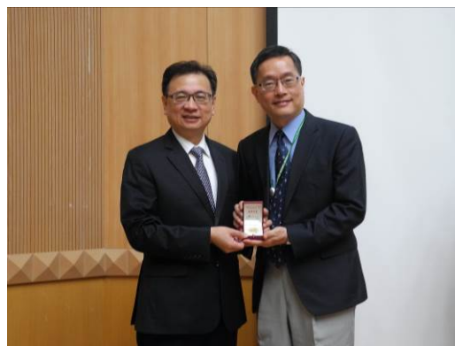
醫學系麻醉學科 陳大樑教授