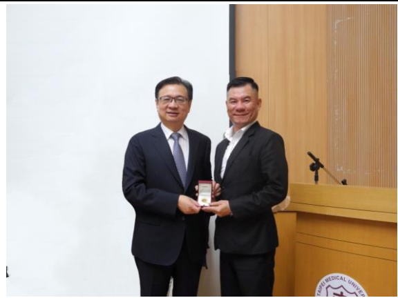
總務處 沈盛達編纂