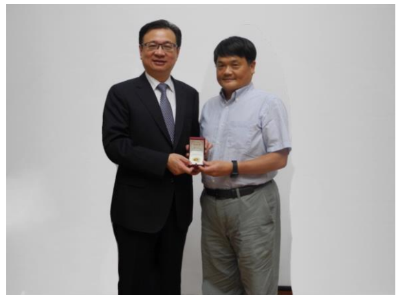
醫學科學研究所 陳瑞明教授