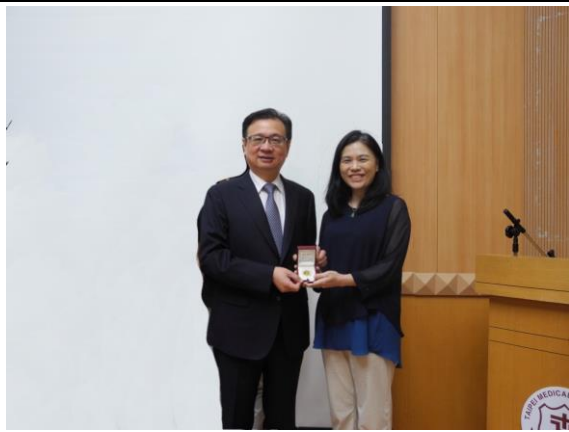
教務處 凌于雯編纂